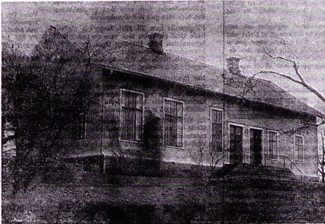
Det här är huvudbyggnaden vid Hummelstads skola. Förutom den här byggnaden finns det ytterligare en där småskola, barnbispisning och slöjd varit inrymda och det är närmast den som skulle kunna användas som samlingslokal.