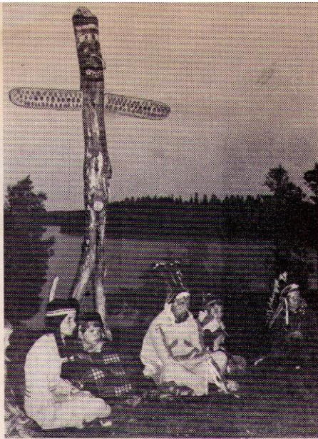
Till Kogarelägret kom indianer från fyra distrikt.