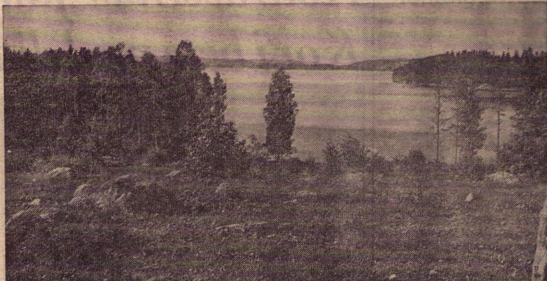
På den här natursköna platsen vid sjön Kogaren i Hallingeberg kommer fyra läns IOGT-scouters att samlas till läger i juli.